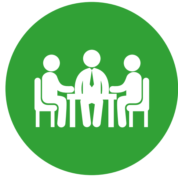
Réunion relationnelle de démarrage