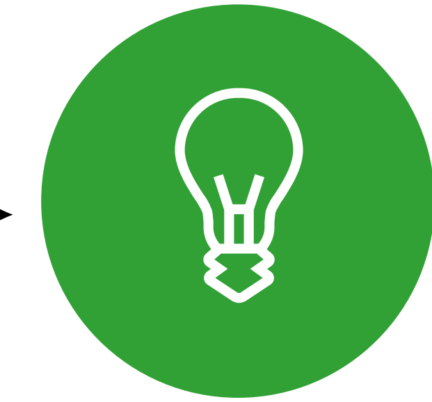
Propositions et démo